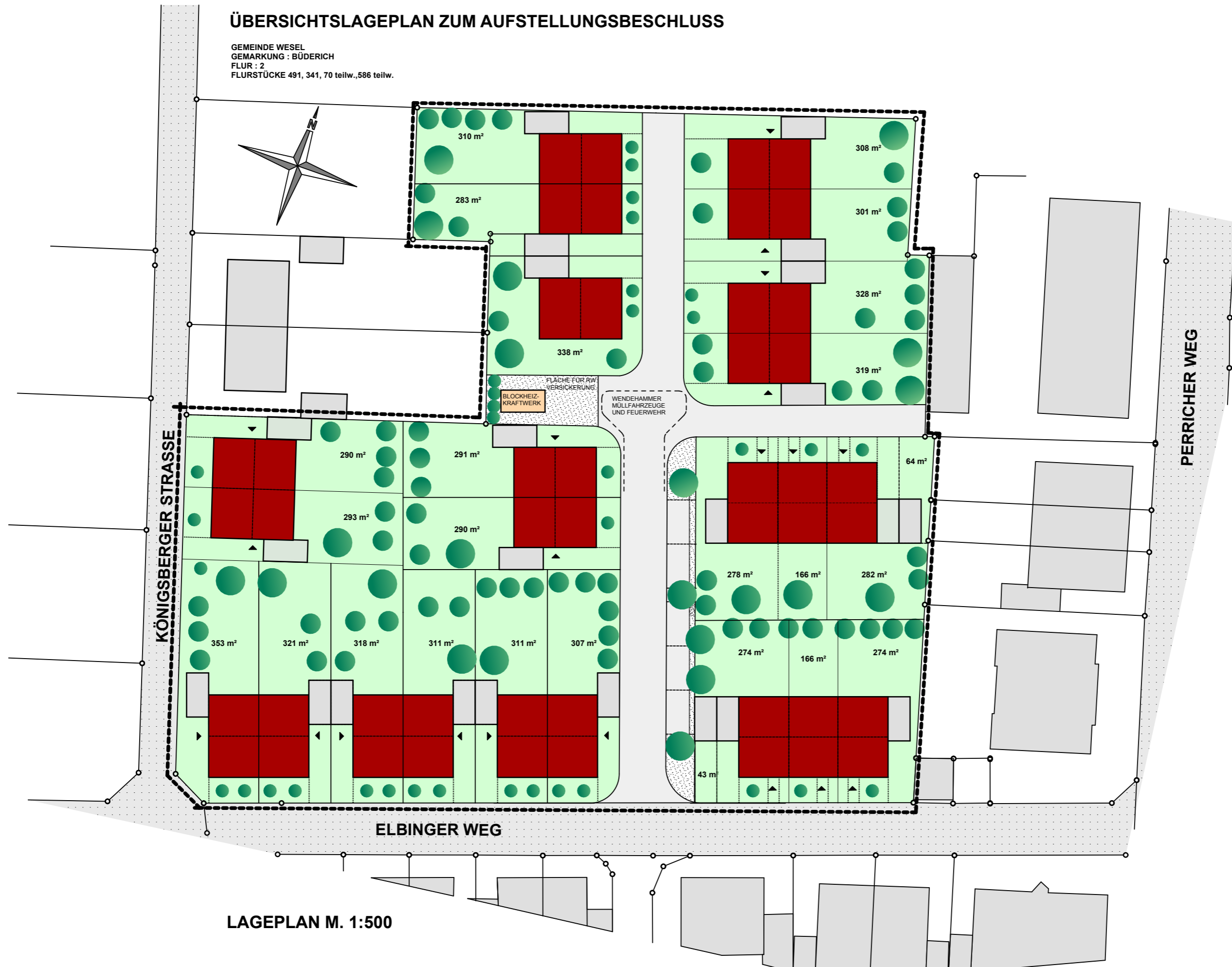
LAGEPLAN M. 1:500

VORHABEN- BEZOGENER BEBAUUNGS- PLAN NR. 16 ELBINGER WEG